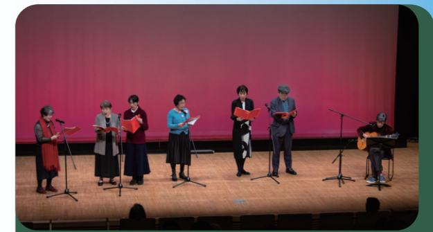
Moulin Rouge ムーラン・ルージュ