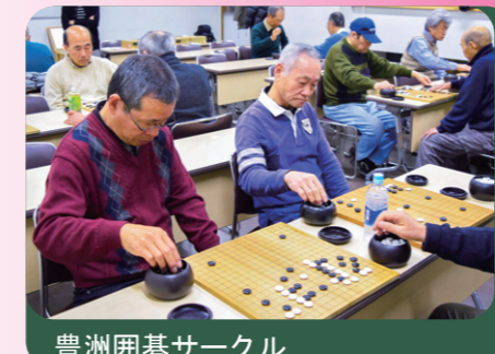
豊洲囲碁サークル