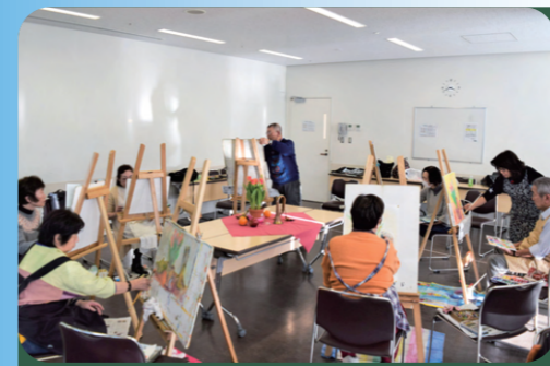
豊洲デッサン教室