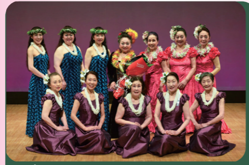
ピアノニ高橋ハワイアンフラ豊洲