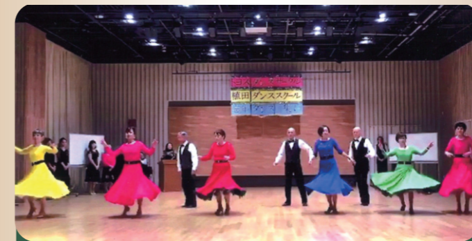
トヨスダンスサークル