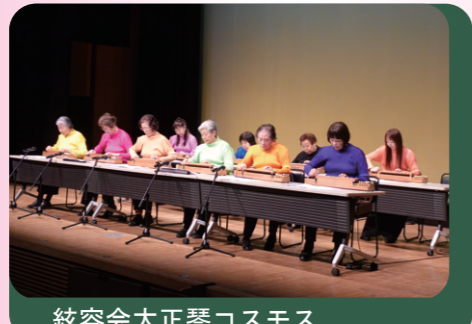
絃容会大正琴コスモス