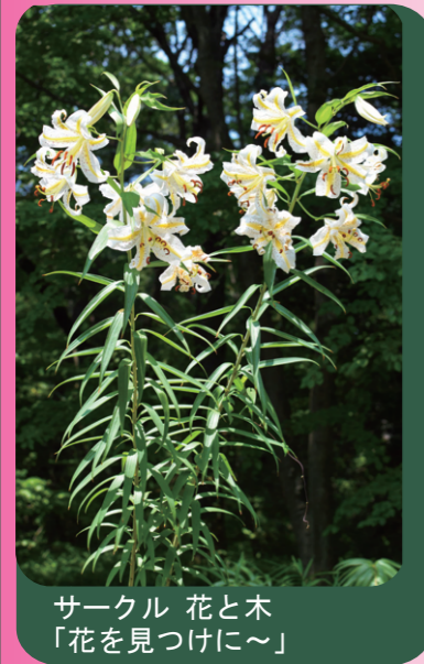
サークル 花と木 「花を見つけに〜」