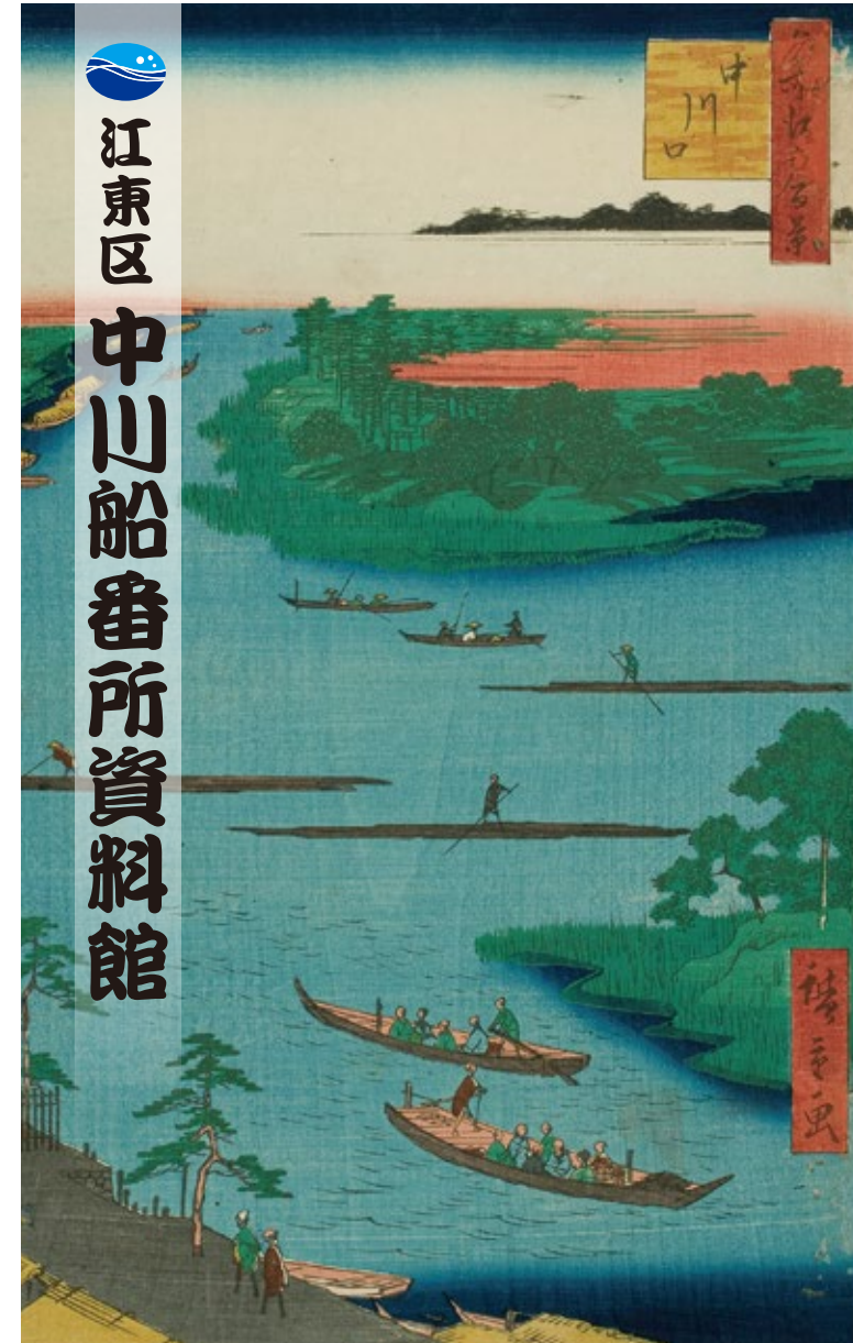
「名所江戸百景 中川口」歌川広重画(部分)