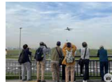
写真倶楽部フォト森下