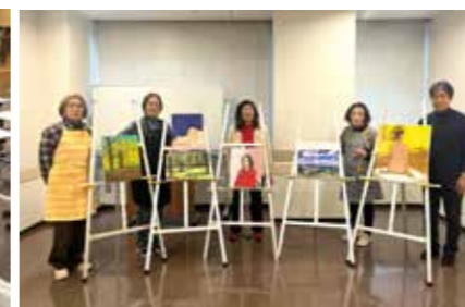
人生にゆとり 絵画の時間