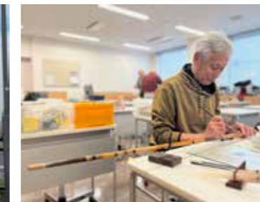
江戸和竿 寿晴深川会