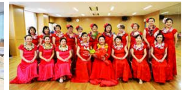
ブアナニ高橋はじめてのハワイアンフラ