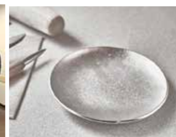
趣味の錫工芸講座