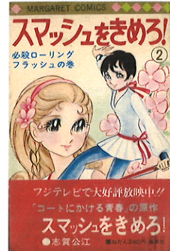
『スマッシュをきめろ!』②(集英社)

1967年、『週刊マーガレット』増刊号の『走れ!かもしか』でデビュー。69年、『週刊マーガレット』に『スマッシュをきめろ!』を発表。少女マンガにスポ根を導入、テニスマンガの草分けとなる。レディスコミック界で『虹子ラブパイ』等を描く。代表作は『狼の条件』、『花と竜』等。2011年より京都造形芸術大学マンガ学科学科長を務めた。