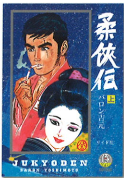
『柔侠传』上(リイド社)

1959年、貸本劇画誌『街』でデビュー。その後、横山まさみち、長沢 節の教えを受ける。70年、『週刊漫画アクション』に『柔侠传』を連載、柔道に生きた3代の男たちの軌跡を描く。近年は画家としても活躍中。2019年2月には新装版『柔侠传』（リイド社刊）が出版された。第48回日本漫画家協会文部科学大臣賞受賞。