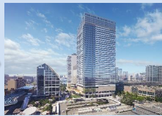
(仮称)豊洲二丁目駅前地区 第一種市街地再開発事業 2-1 街区