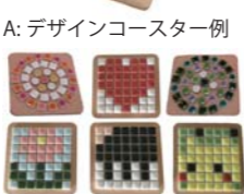
A: デザインコースター例 B: ワクワクコースター例

主催・会場：江東区文化センター (江東区東陽 4-11-3*東京メトロ東西線「東陽町」駅下車 1 番出口徒歩 5 分)