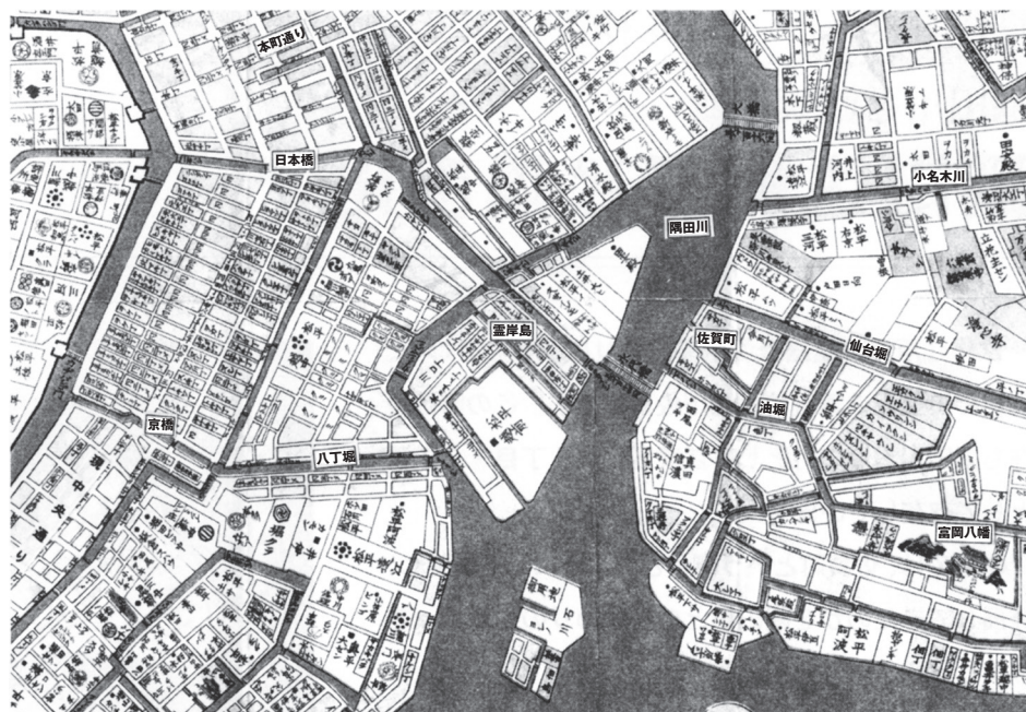
「御江戸大絵図」(複製) 天保14年(1843) 日本橋界隈と霊岸島・深川周辺が江戸経済を担っていました。

佐賀町には町を南北に貫く通りがあり、その西側、隅田川沿岸には河岸屋敷と呼ばれる蔵が立ち並び、一方の通りの東側には表店として商店が並んでいました。隅田川から直接河岸屋敷の蔵に品物を納め、それを通り1つはさんだ店舗で商うといった町のシステムが作られていました。また、東へと延びる仙台堀・中之堀・油堀などの沿岸にも蔵がひしめき合って立ち並んでいました。とりわけ中之堀南側には三井家の