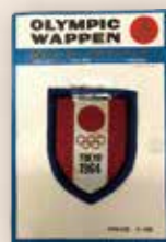
オリンピックワッペン