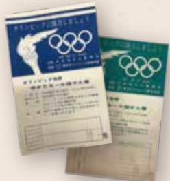
ゆかたセール抽選券