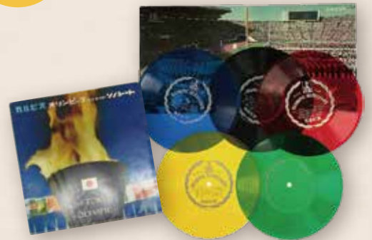
オリンピックハイライトソノシート

1964年 東京で開催された第18回オリンピック。日本はこの時まさに高度経済成長期。