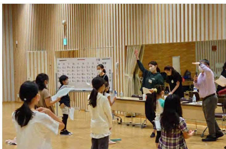
レッスンの様子(演技)

2020年度より開始した「豊洲こどもミュージカル」のレッスン受講生を募集します。