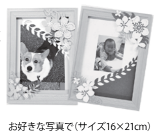
お好きな写真で(サイズ16×21cm)

森下文化センター 〒135-0004 森下3-12-17 Tel ☎5600-8666 Fax ☎5600-8677 （第1・3月曜日休館） ただし祝日の場合は開館