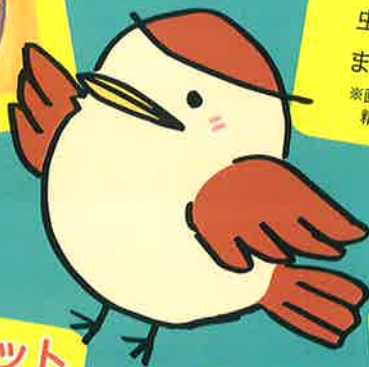
はごべらすずめちゃん