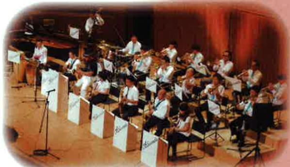
オブサンズ・ジャズ・オーケストラ