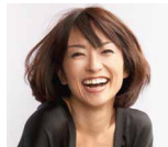
トーク・MC 住吉美紀 (フリーアナウンサー)