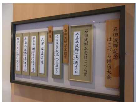
石田波郷記念館前 短冊