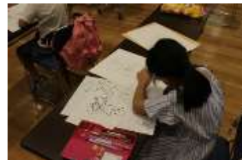
過去の「夏休みこどもマンガ工房」の様子