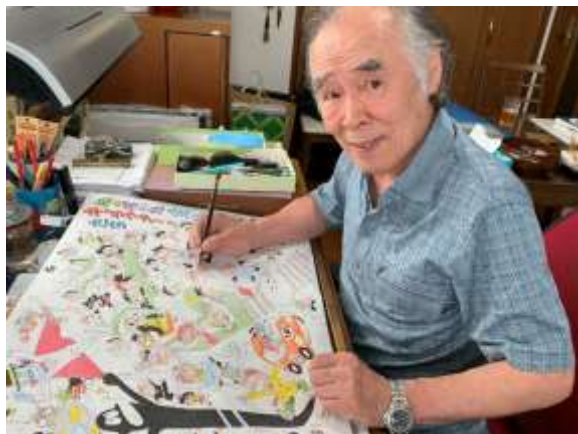
山根青鬼先生がマンガを描く様子