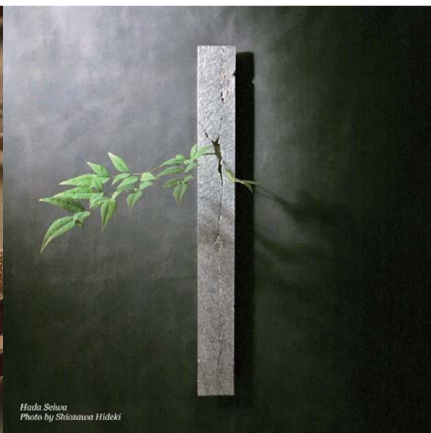
講師作品／帯留(左)、掛花入(右)

日程：平成29年10月23日（月）、11月27日（月）、12月11日（月） 平成30年1月22日（月）、2月26日（月）、3月12日（月） 全6回 14:00～16:00