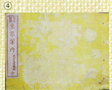
① 中川番所鑑札(複製) ② 通行手形 ③ 江戸名所神社仏閣町々案内 ④ 改正増補東京案内 すべて中川船番所資料館蔵