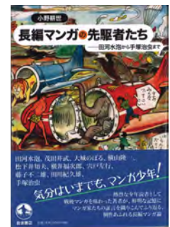
講師著作(岩波書店)