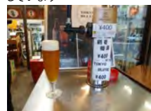
最高においしい生ビールを!

A. Q. 今後の意気込みを ずっと続けていきたいですね。 クラフトジンもやってみたくと思 っています。