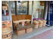
店頭角打ちコーナー 不要になった酒樽などを利用 しています

【田口屋】 江東区常盤二一六一十一 ○三(三三三)四四七一一 営業時間 九時~二十時 定休日 日・祝