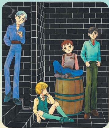
「つれて行って」第24回 扉[1981]