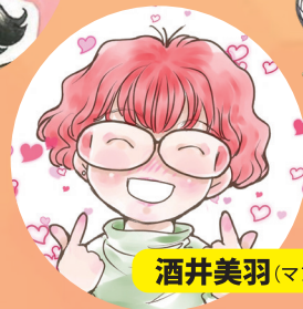
酒井美羽(マンガ家)