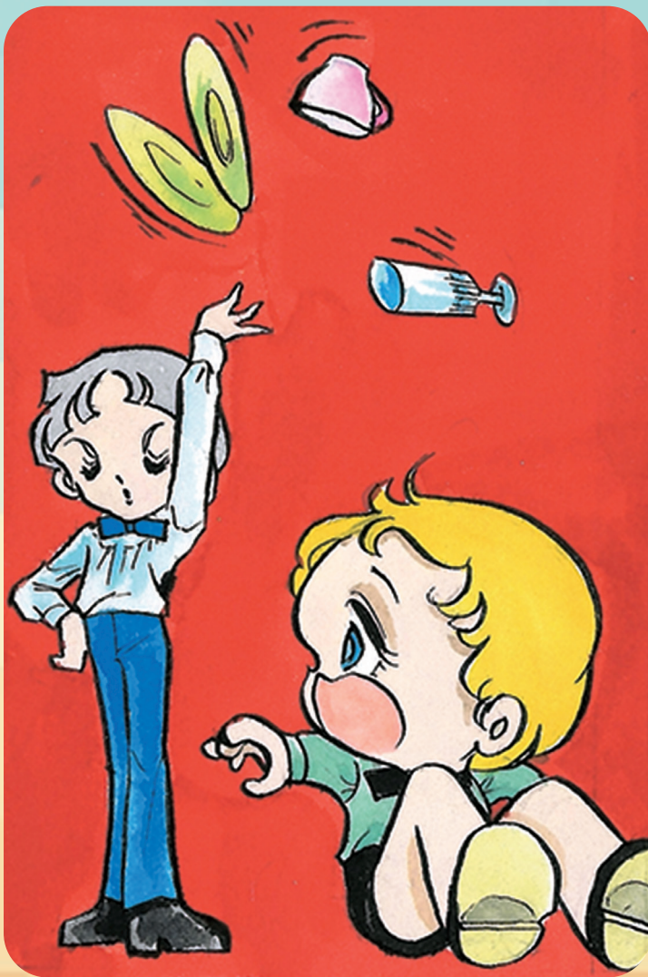
「夢をごらん」前編予告カット[1976]

マンガ家・三原順(1952-1995)は、代表作『はみだしっ子』シリーズで1970～80年代に熱狂的な人気を博しました。今回、代表作『はみだしっ子』のカラー原画を中心とした「三原順原画展～夢をごらん～」の開催に合わせ、親交のあったマンガ家の笹生那実さん、酒井美羽さんをゲストに迎え、少女マンガ研究者である藤本由香里さんが話を伺うトークイベントを開催いたします。今なお新しいファンを獲得し続けている三原ワールドについて、また「人間・三原順」について、今までのトークイベントでは入りきらず、はみだししてしまっていた話題を交えてまいります。