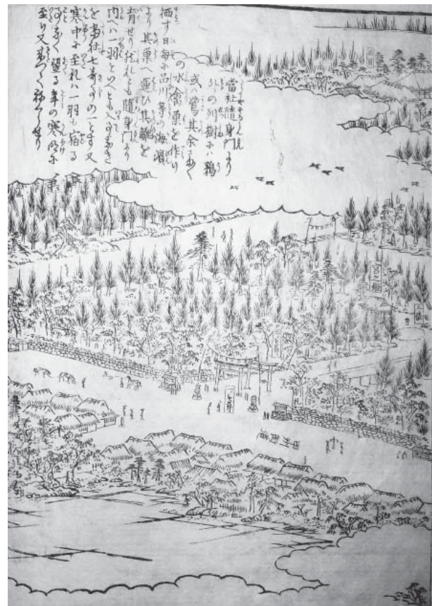
府中六所宮(部分)『江戸名所図会』 天保7年(1836) 館蔵

以上、江戸の町に伝わる七不思議について、当時の記録から紹介してきました。七不思議の記録をみていくと、「七不思議」として数え上げる時点での意識がそれぞれ異なっていることや、「七不思議」とされる前の個別の伝承としての在り様も様々であることがわかります。今後は、江戸の周縁部に位置する伝承といった指摘に加え、新たな視点から検証していく必要があるようです。