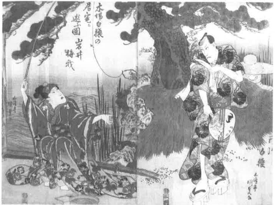
浮世絵「木場白猿の居宅二遊ぶ図」 五波亭国貞画 深川図書館蔵

島田町の別荘は、4代目以来代々の住まいとなり、特に有名な7代目もここに住みました。7代目は、市川家という家の伝統を大きく意識し、初代以来の荒事の当り役を調べ「歌舞伎十八番」を制定しました。天保13年(1842)奢侈を禁じる天保の改革令に違反し、江戸十里四方追放となりましたが、嘉永2年(1849)