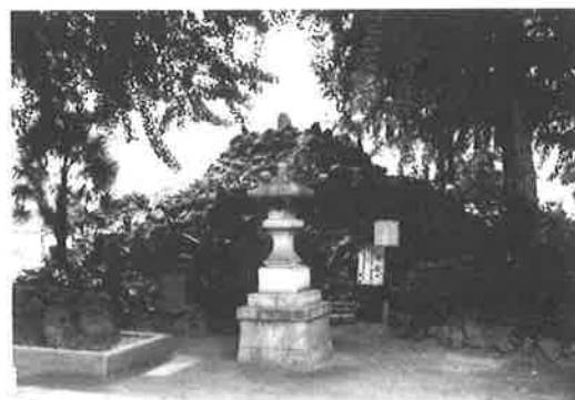
富岡八幡宮の富士塚

このように、砂村元八幡は、堤防もでき桜の名所・景勝地として江戸庶民に知られるようになり、海岸伝いに訪れる人々が増え、江戸近郊の行楽地として親しまれました。