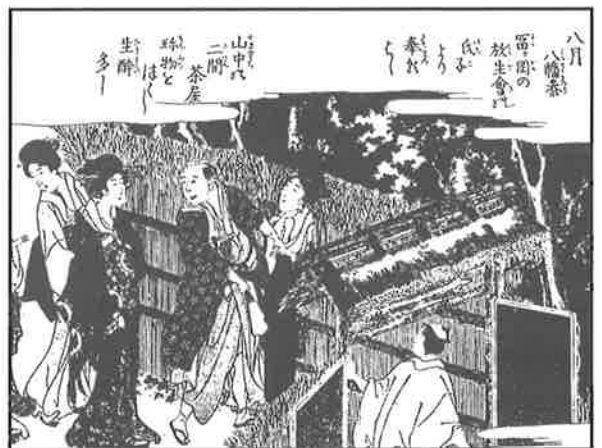
絵①『絵本東わらは』より

そして初めは、簡単な造りの出店や茶屋だったのが、享保の頃からは料理屋や置屋・揚屋も増えて花街として栄えるようになりました。『江戸名所図会』（1836年）はこの門前町の様子を次のように記しています。「当社門前 とりい 一の華表より内、四町が間は、両側茶肆・酒肉店軒を並べて、つねに絃歌の声絶えず。ことに社頭には二軒茶屋と称する貨食屋 りょうりや などありて、遊客絶えず。牡蠣・蜆 しじみ ・花蛤・鰻鱺魚 はまぐり の類をこの地の名産とせり。」