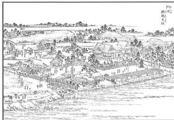
絵③『江戸名所図会』より