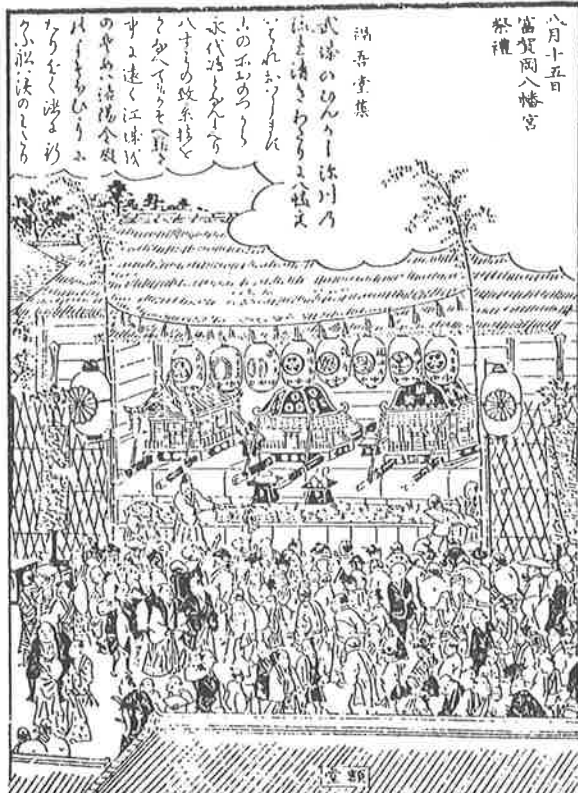
富賀岡八幡宮祭禮『東都歳事記』（斎藤月峯）

お盆は、草市で始まります。草市は盆市とも呼ばれ、7月12日の夜から13日の朝まで開かれました。竹・粟穂・稗穂・茄子・紅の花・青柿・青栗