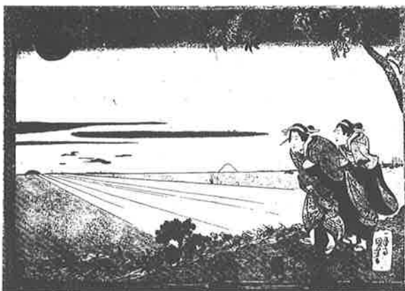
「東都名所洲崎初日出の圖」(一勇齋國芳画)

大晦日の忙しさから一夜明け、各家では静かな新年を迎えます。夜通し起きていた商家の人々はそのまま初詣にいき、屠蘇を祝い、雑煮を食べて休むものも多かったようです。雑煮・福茶は「若水」といって元旦に初めて汲んだ井戸水で作りました。福茶とは甲州梅・大豆・山椒を二、三粒ずつ入れて煮たものです。一般的に六日までを松の内といい、松飾りも六日の夕方に取り除かれました。