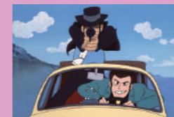
ルパン三世 カリオストロの城