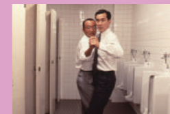
Shall we ダンス?