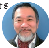
手話弁士：米内山明宏 (運営：バリアフリーシネマサークルチーム柏) 音声ガイド運営：江東シネマアイ