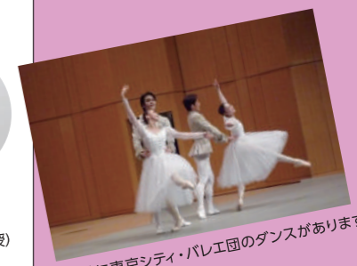
開演時に東京シティ・バレエ団のダンスがあります。

監督・脚本：周防正行 出演：草刈民代 / 役所広司 / 浅野忠信 / 大沢たかお 2012年(平成24年) 東宝 144分 カラー 35mm フィルム