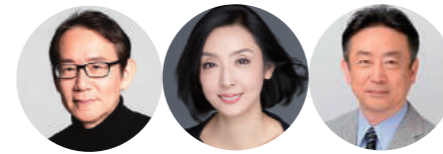
ウエルカムダンス：東京シティ・バレエ団 ゲスト：周防正行(映画監督) 草刈民代(女優) 司会：柴田秀一(元TBSアナウンサー・日本大学法学部教授)